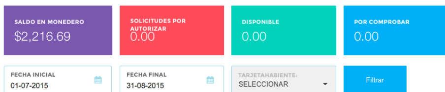
GASTOS POR CONCEPTO